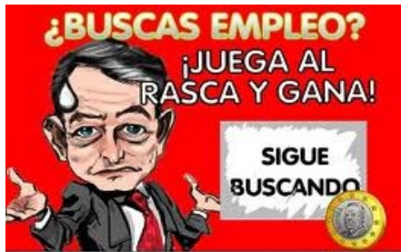
Imagen del "Rasca y Gana" virtual una vez que el internauta rasca el cupón.